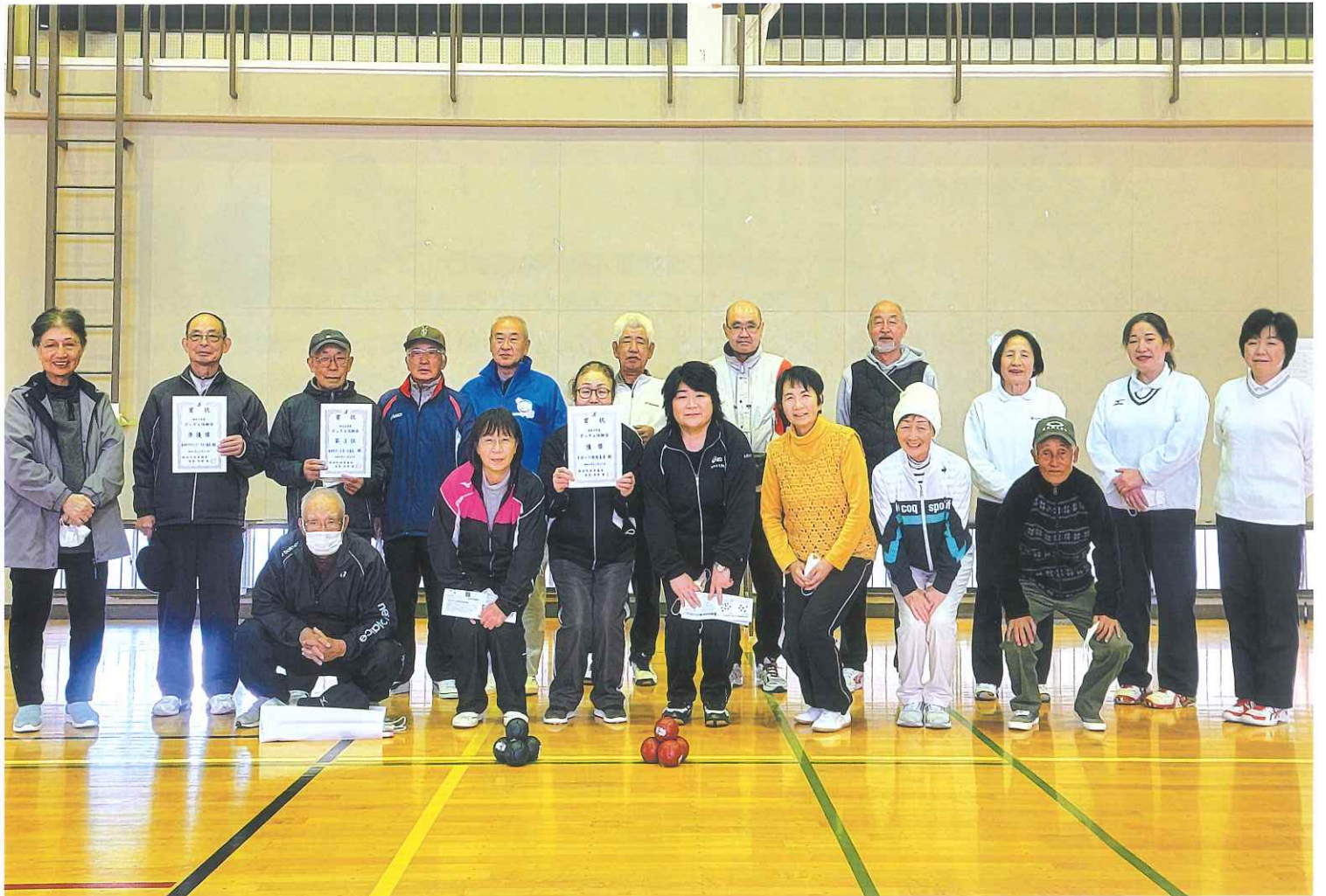
令和4年11月20日「ボッチャ体験会」 (船岡体育館)